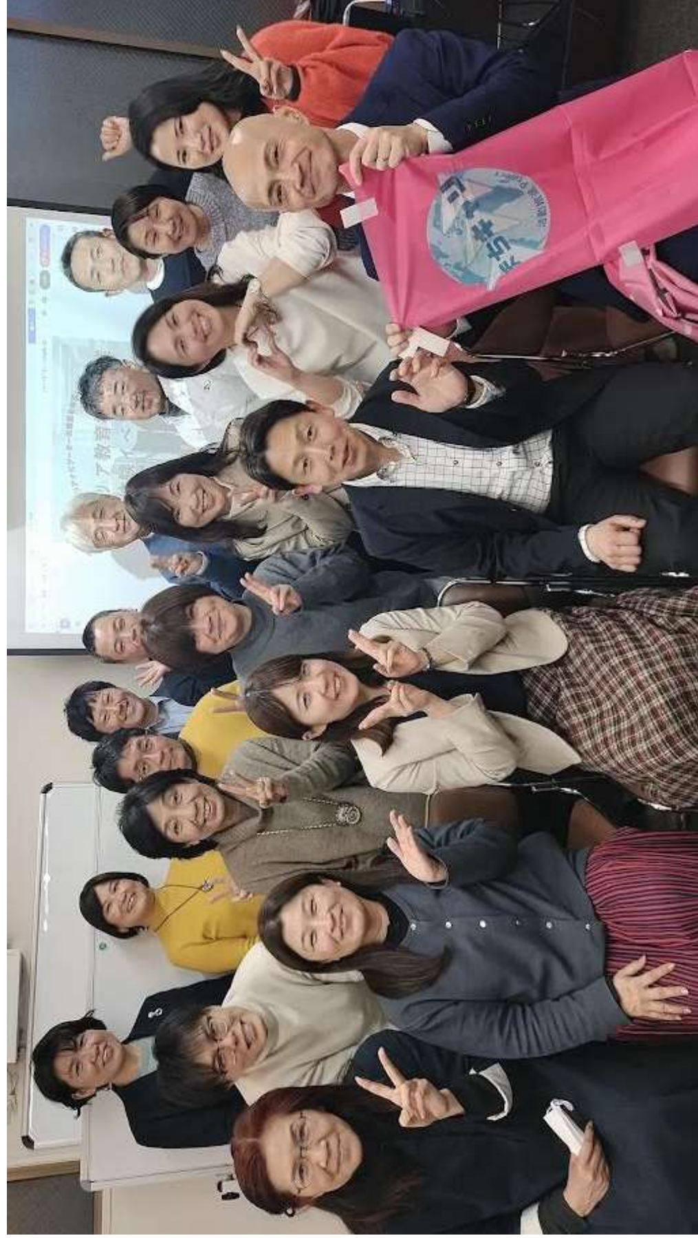
ご参加の皆様 ご主演キャリアナビゲーターの方々 ご協力ありがとうございました 高安